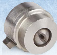
Сопло для комбинированного распыления