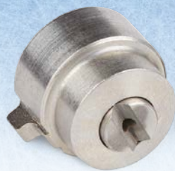
Сопло для безвоздушного распыления