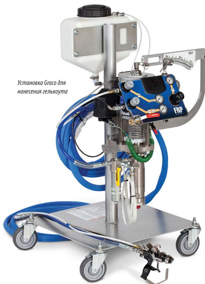
Установка Graco для нанесения гелькоута

Ниже мы покажем почему. Оборудование Graco FRP соответствует требованиям МАСТ и использует сопла двух типов – одно сопло, предназначенное для комбинированного распыления, а другое – для обычного распыления материалов. С помощью Graco Вы сможете перейти от комбинированного распыления к обычному распылению, путем простой замены сопла.