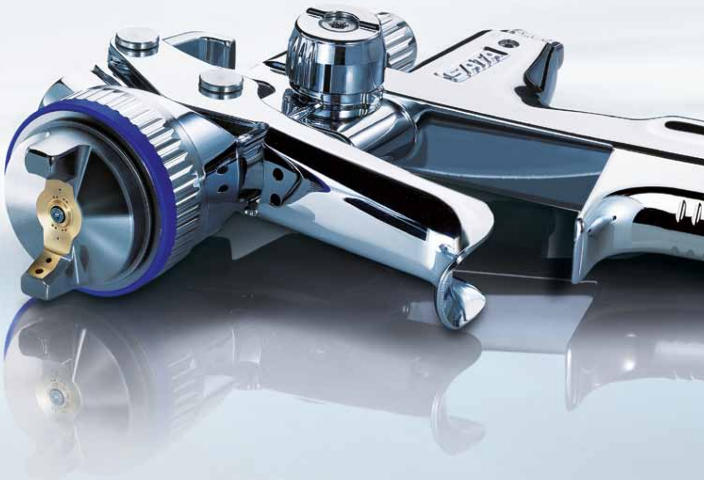
Давление всегда под контролем – версия DIGITAL®: Встроенный манометр с регулятором давления – необходим для точного цветового соответствия.